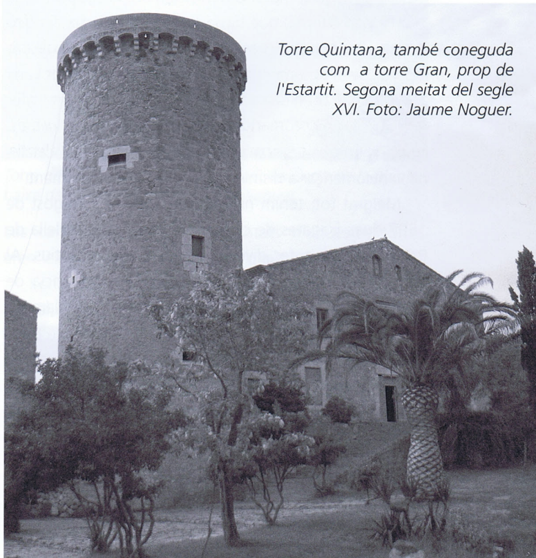
Torre Quintana, també coneguda com a torre Gran, prop de l'Estartit. Segona meitat del segle XVI.

estiguessin en guerra amb la Corona d'Aragó, sota pena d'una multa de 20.000 florins. L'any 1450, el pirata Joan Torrellas va atacar Roses i uns quants masos propers a Torroella de Montgrí amb la seva galera. Cal recordar, per altra banda, que les illes Medes van ser ocupades l'any 1442 per corsaris genovesos i posteriorment per barbarescos, i des d'aquest punt es van dedicar a fustigar a pescadors i poblacions de l'entorn.