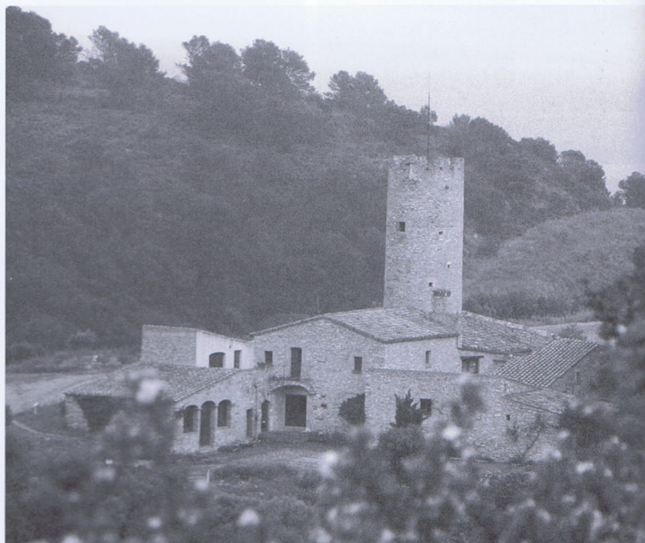
A dalt, la torre del Mas Pic (Begur).

"Síntesi del llibre Pirates, corsaris i torres de moros de Jaume Noguier i Agustí Alcoberro, editat l'any 1998 per l'Ajuntament de Palafrugell i la Diputació de Girona"