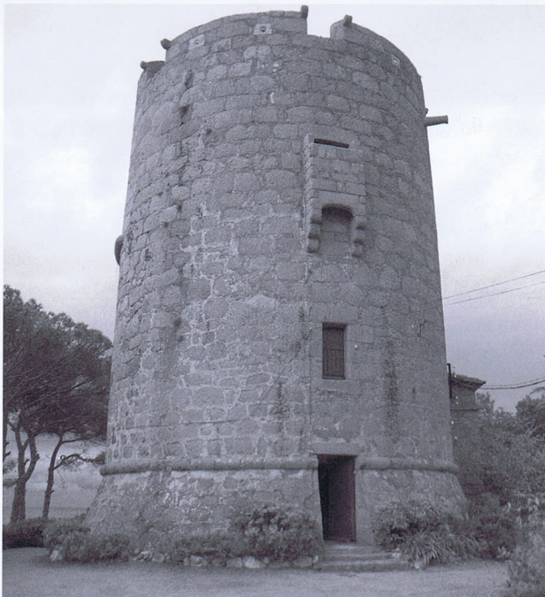
Torre de Calella, acabada l'any 1599. La porta de la planta baixa data de 1898.

Les característiques i particularitats d'aquestes torres eren les següents [Veure imatge a la pàgina següent]: