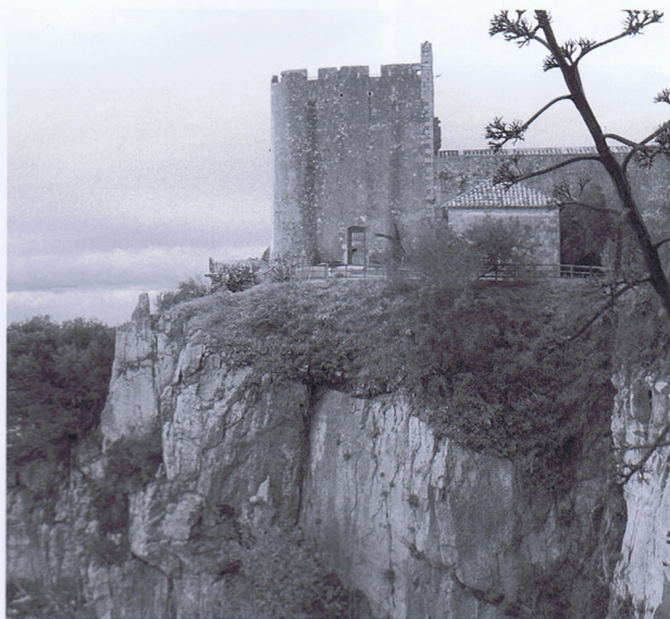
Torre de Sant Sebastià de la Guarda, sobre el penya-segat de Romaboira. Iniciada l'any 1445.

Als masos que comptaven amb una torre on poder-se resguardar, hi guardaven les coses de valor, agafaven els aliments necessaris i s'hi preparaven per a la defensa.