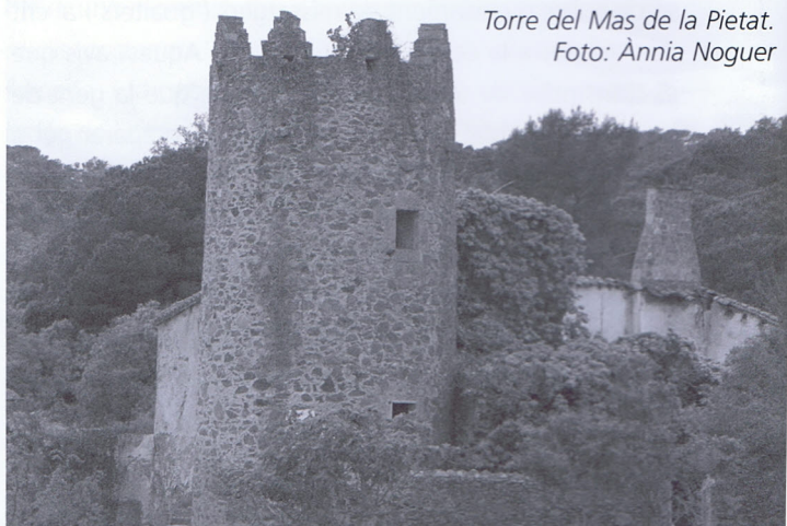
Torre del Mas de la Pietat.