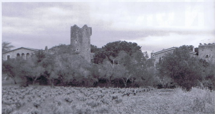
A dalt, les torres del Mas Espanyol i del Mas Borrull, al veïnat de Sant Margarida (Palafrugell). A baix, la torre Lloreta (Calonge). Segle XIII.