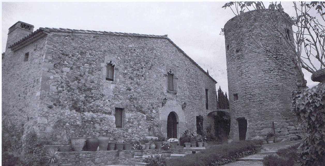
Torre d'en Deri, també coneguda per torre Pedrissa, unida al mas a través d'un pont. (Pals). Segle XVI.

No obstant, els atacs més durs i coneguts van tenir lloc al llarg dels segles XVI i XVII, i van ser perpetrats majoritàriament per corsaris amb base a Alger o en altres ports de Barbària. La tardor de 1543 l'armada turca, amb Barba-rossa al capdavant, va desembarcar a Cadaqués que, sense defenses importants, no va oferir massa resistència al saqueig de la vila i a l'enderroc de l'església. El dia 6 d'octubre van fer el mateix a Roses, i durant els dies 7 i 8 van atacar i saquejar Palamós, matant cruelment a tot aquell qui trobaven i cremant l'església.